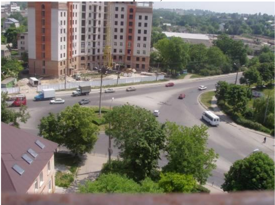
Транспортна розв'язка вулиць Микулинецька, Живова, Острозького, Замонастирська, Гайова у м. Тернопіль (стаціонарний пост спостереження за станом атмосферного повітря № 2)