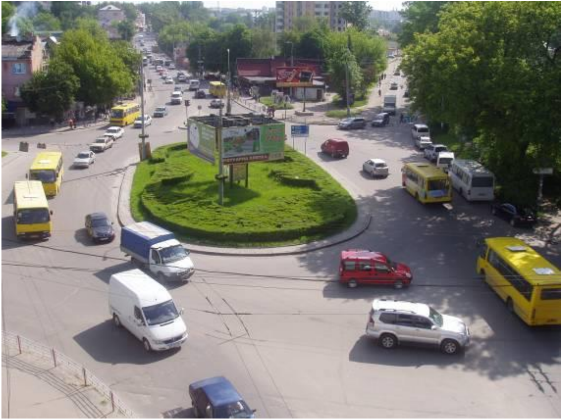
Транспортна розв'язка вулиць Збараської, Бродівської, Галицької у м. Тернопіль (стаціонарний пост спостереження за станом атмосферного повітря № 1)