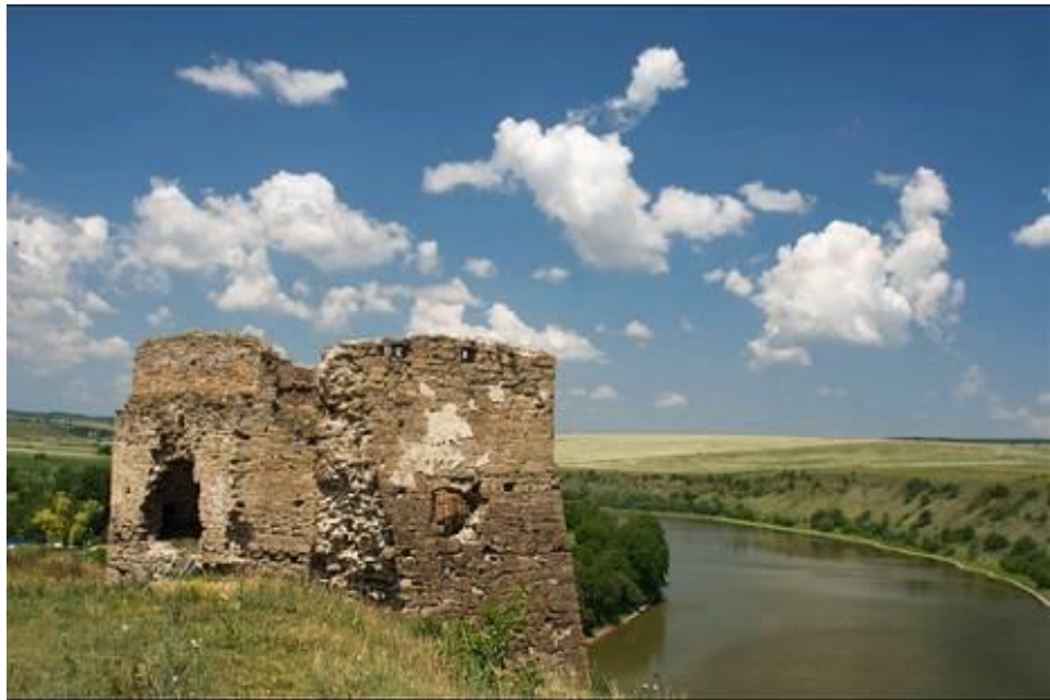
мал.2.5. Річка Збруч

Річка Стрипа – третя за величиною з лівих приток Дністра у межах Тернопільської області. Починається вона від злиття декількох невеличких потічків (Стрипи Івачівської, Стрипи Вовчовецької, Стрипи Коршилівської і Східної Стрипи), які утворюють ніби віяло витоків Стрипи. Площа її водозабору становить 1610 км 2 . Від витоків до с.Соколів Терехівського району долина Стрипи неглибока. З пологіми схилами і широкою заплавою. У низ від с.Соколів долина глибшає, стає звивистою, а схили її робляться стрімкими, скелястими, з лісово-чагарниковими заростями. Водному режиму річки властива весняна повінь і дощові паводки у літньо-осінній період, а також незначні підйоми рівня води зимою. Такі особливості режиму зумовлені характером живлення річки.