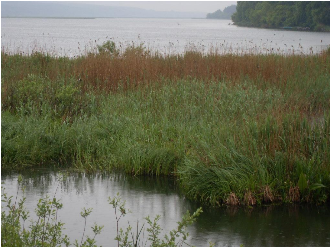
Мал.2.2 Івачівське водосховище

Контроль за станом р. Серет Івачівського водосховища протягом липня не проводився.