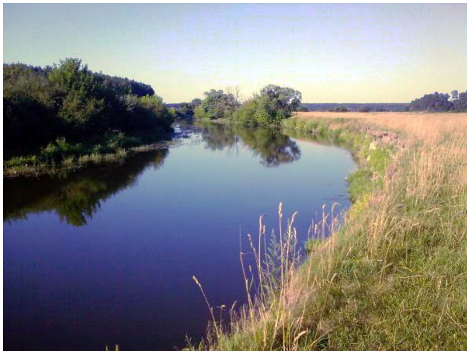
Мал. 2.6.Річка Горинь

Контроль за станом р. Горинь 24 липня 2018 року в створі, який знаходиться в м. Ланівці. При аналізі результатів виявлено перевищення ГДК по показнику хімічного споживання кисню ( 21,0 \text{ мгО/дм}^3 при ГДК 15,0 \text{ мгО/дм}^3 ), біологічного споживання кисню ( 3,04 \text{ мгО/дм}^3 при ГДК 2,25 \text{ мгО/дм}^3 ), азоту нітратного ( 0,07 \text{ мг/дм}^3 при ГДК 0,02 \text{ мг/дм}^3 ) (для водних об'єктів рибогосподарського призначення). Збільшення хімічного та біологічного споживання кисню свідчить про органічне забруднення.