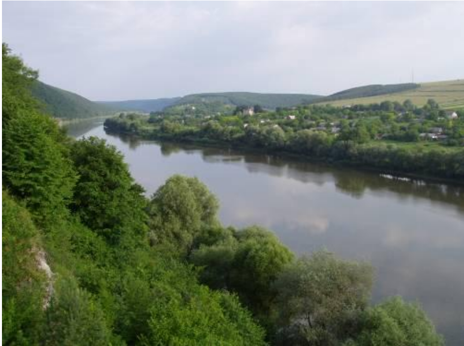
Мал.. 2.3. Касперівське водосховище на річці Серет

Контроль за станом р. Серет в районі Касперівського водосховища протягом липня не проводився.