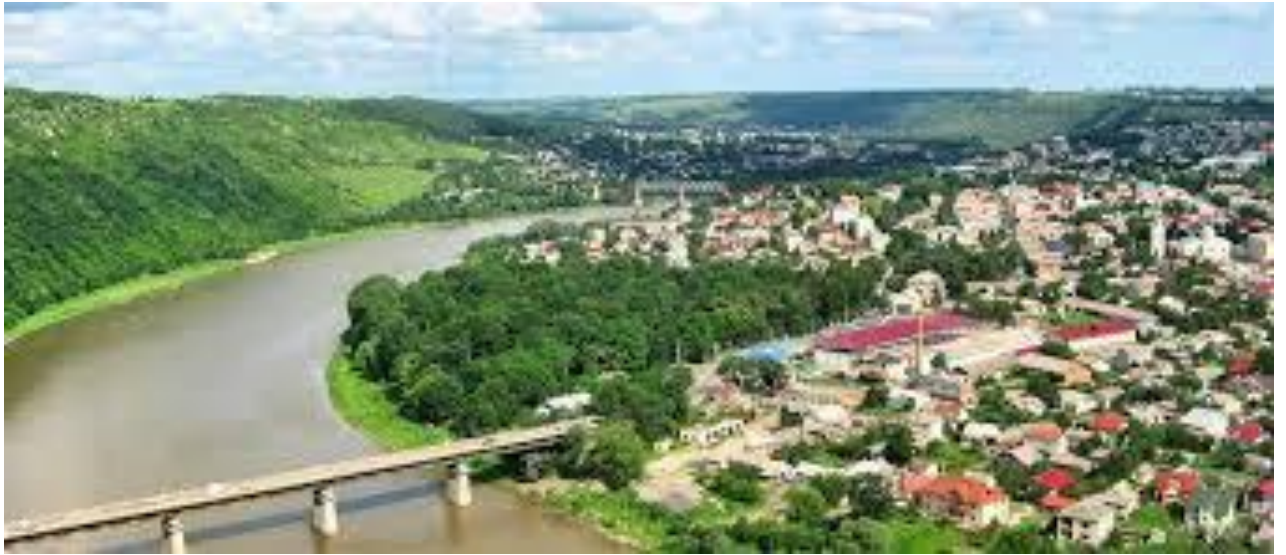
мал. 2.4. Річка Дністер місто Заліщики

Річка Серет є однією з найдовших річок області. Це ліва притока р.Дністер, яка відноситься до категорії середніх річок. Довжина її складає 248 км. Річка Серет бере початок із джерел, розташованих в с.Нище Зборівського району. Площа водозабору – 3900 км 2 , загальний перепад висот – 230м, середній ухил - 0,93%. Басейн річки розташований в північно-західній частині Волино-Подільської височини. Поверхня порізана сіткою ярів і балок. Річкова сітка густа. В басейні протікає 490 річок і струмків загальною довжиною 1706 км. Русло звивисте. Ширина річки – 10-30м, глибина на перекатах – 0,2-0,7м, на плесах 1,5-3м. Швидкість течії води 0,3-0,5 м/с, на перекатах – до 2 м/с. Сток р.Серет зарегульований каскадом водосховищ, на 3-х з них проводиться відбір проб води на гідрохімічний аналіз.