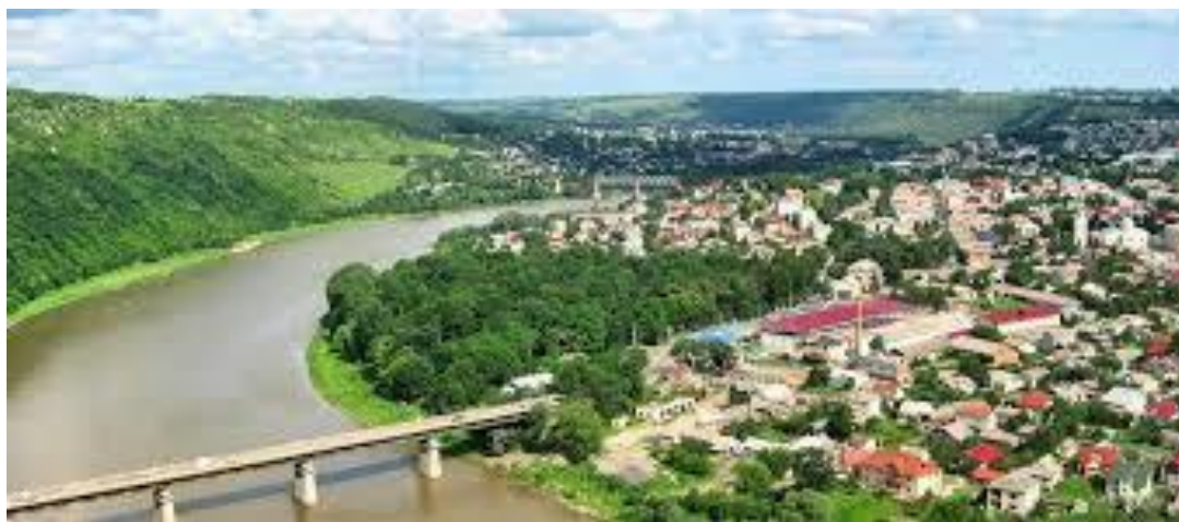
мал. 2.3. Річка Дністер місто Заліщики

Річка Дністер є другою за розмірами рікою України і головною водною артерією Молдови. Ріка починається в Карпатах на висоті 760 м над рівнем моря недалеко від села Вовче Турківського району Львівської області і тече спочатку на північ, а далі на південний схід через Західну Україну, Поділля. І вже недалеко від Одеси впадає у Чорне море, а точніше у Дністровський лиман. Традиційно Дністер поділяється на такі три частини: верхній (від витоків до гирла Золотої Липи), середній (від гирла Золотої Липи до гирла Реута недалеко від Дубоссар) і нижній (від гирла Реута до Дністровського лиману). Загальна довжина річки – 1352 км, площа водозабору – 72100м 2 . Загальне падіння 759 м, середній нахил водної поверхні – 1,78%. У межах області Дністер має довжину 262 км. На схід від с.Нижнів Дністер є границею між Івано-Франківською і Тернопільською областями, а від с. Зелений Гай Тернопільської області з Чернівецькою областю. Басейн Дністра має форму вигнутого посередині овалу, довжина якого 700 км, середня ширина – 120 км. Режим ріки висвітлюється на водомірному посту в м.Заліщики, де водомірні спостереження ведуться з 1850 року. Основними елементами спостережень були рівні води і льодові явища. За характером гідрологічного режиму залежить від своїх приток – річок Карпатської зони і Поділля. Найбільше значення в режимі Дністра мають Карпатські притоки, які його й визначають.