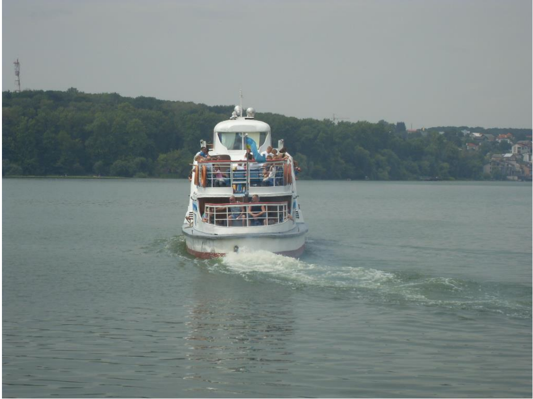
Мал. 2.1. Тернопільський став

Івачівське водосховище р. Серет відноситься до категорії господарсько-побутового призначення.