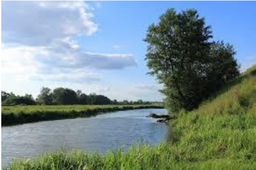
Мал. 2.6. Річка Іква