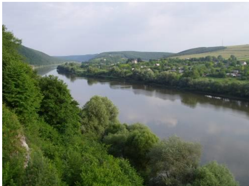
Мал.. 2.2. Касперівське водосховище на річці Серет

Контроль за станом р. Серет в районі Касперівського водосховища протягом квітня не проводився.