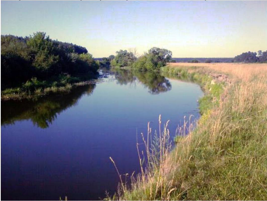
Мал. 2.5.Річка Горинь

Контроль за станом р. Горинь протягом квітня не проводився.