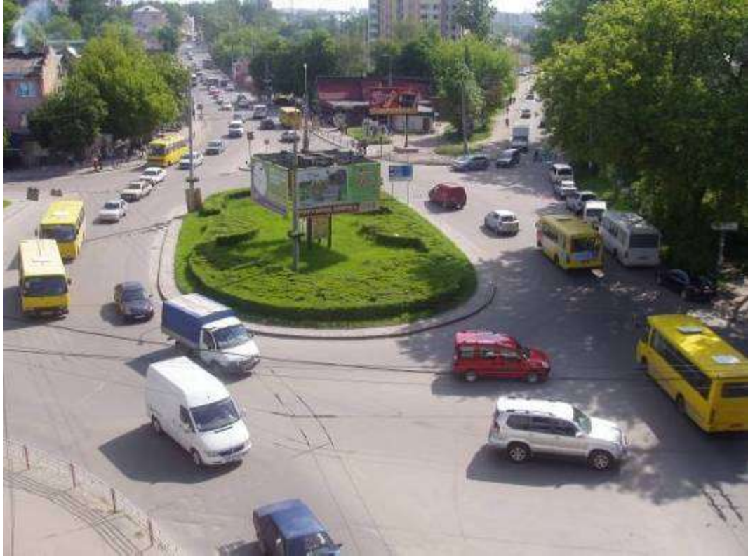
Транспортна розв'язка вулиць Збараської, Бродівської, Галицької у м. Тернопіль (стаціонарний пост спостереження за станом атмосферного повітря № 1)