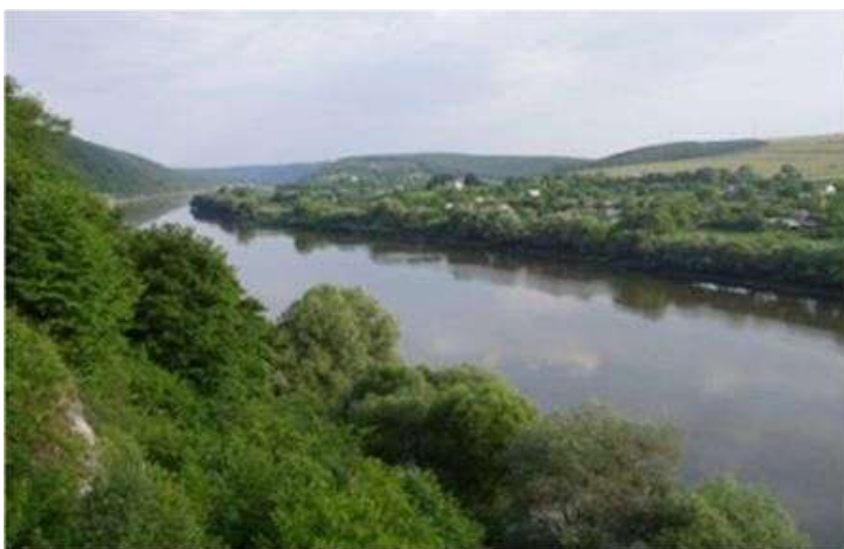
Мал.2.3. Касперівське водосховище на річці Серет

Контроль за станом р. Серет в районі Касперівського водосховища проводився 10 жовтня 2017 року Тернопільським обласним управлінням водних ресурсів у створі в с. Касперівці 6 км (Касперівське водосховище).