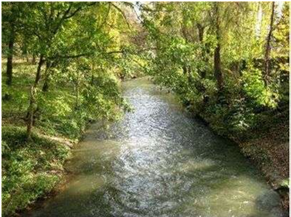
мал.2.7. Річка Золота Липа

Контроль за станом р. Золота Липа проводився 12 жовтня 2017 року Тернопільським обласним управлінням водних ресурсів у створі, який знаходиться в м.Бережани.