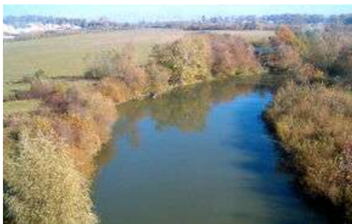
Мал. 2.5.Річка Горинь

При аналізі результатів виявлено перевищення ГДК по показнику БСК 5 (3,04 мгО 2 /дм 3 при ГДК 2,25 мгО 2 /дм 3 ), ХСК (16,0 мгО 2 /дм 3 при ГДК 15,0 мгО 2 /дм 3 ), азоту нітритного (0,03 мг/дм 3 при ГДК 0,02 мг/дм 3 ), заліза загального (0,22 мг/дм 3 при ГДК 0,1 мг/дм 3 ), марганцю (0,06 мг/дм 3 при ГДК 0,01 мг/дм 3 ) (для водних об'єктів рибогосподарського призначення). Це вказує на забруднення річки органічними речовинами і може призвести до загибелі гідробіоти.