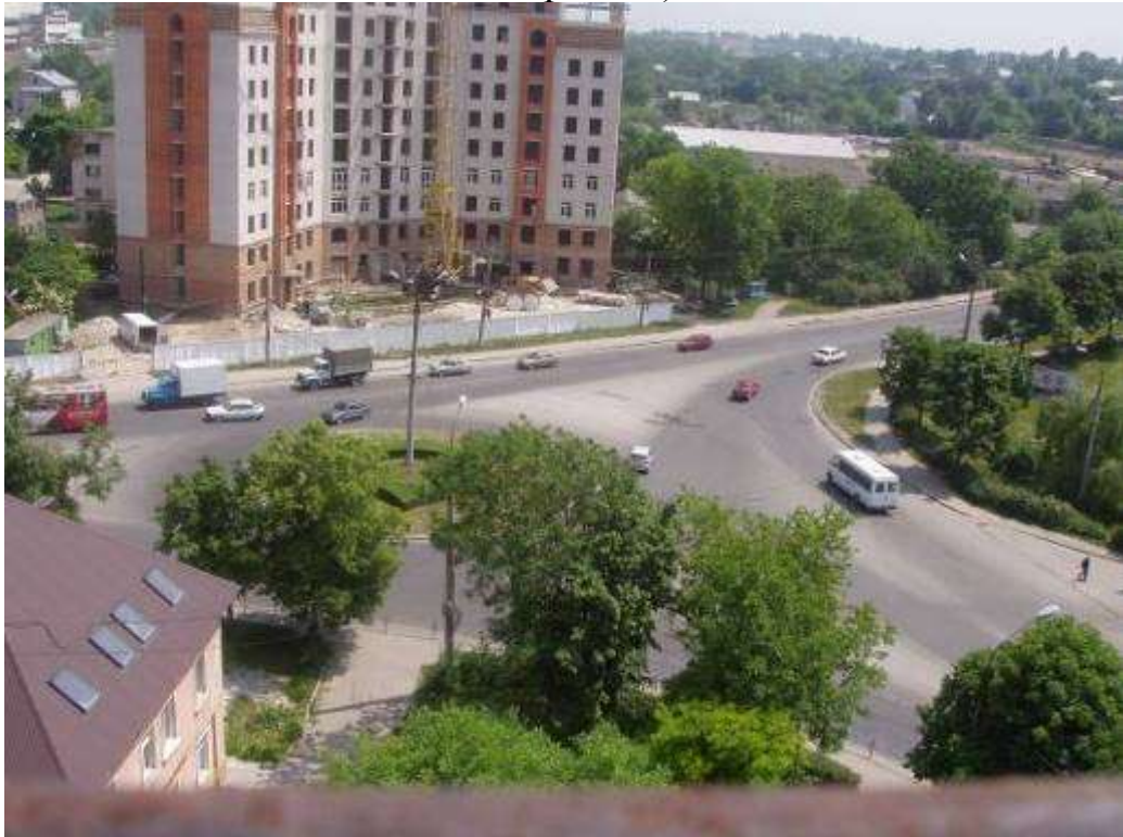
Транспортна розв'язка вулиць Микулинецька, Живова, Острозького, Замонастирська, Гайова у м. Тернопіль (стаціонарний пост спостереження за станом атмосферного повітря № 2)