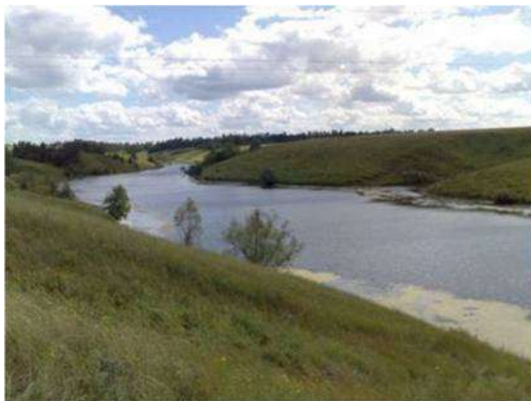
Мал.2.6. Річка Коропець

Контроль за станом р. Коропець проводився 12 жовтня 2017 року Тернопільським обласним управлінням водних ресурсів у створі, який знаходиться в смт. Козова.